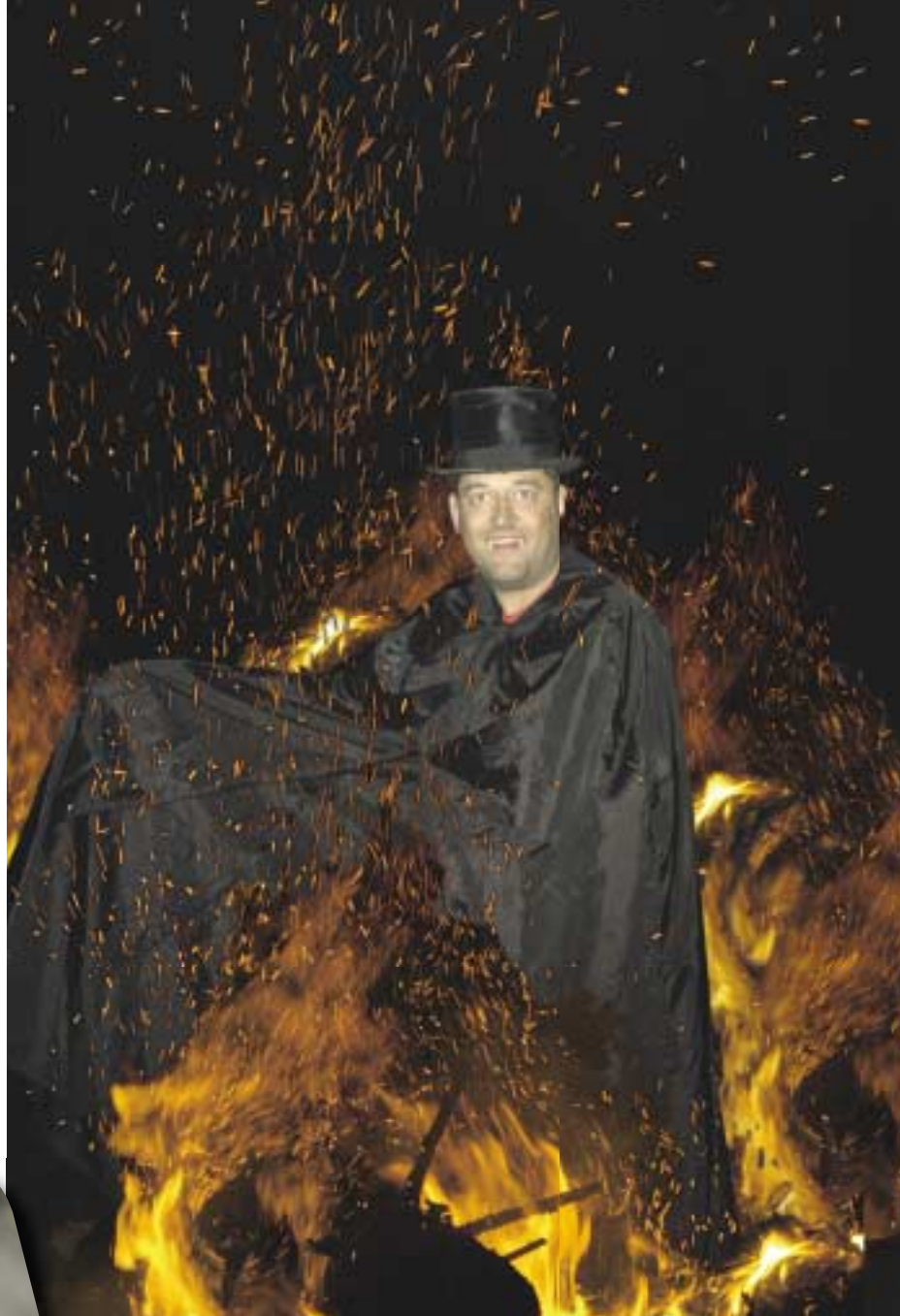
Dracula väntar på dig!