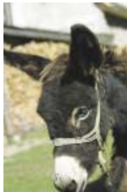
Åsnan Silvex bor på gården.

Vi tar en uppfriskande galopp och efter ett par