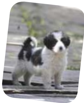
Söta hundar finns det gott om.